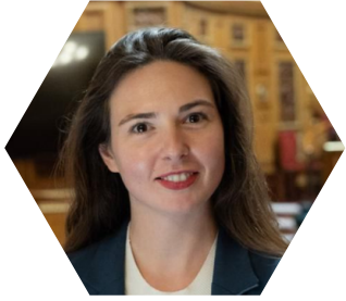
Sophie Briante Guillemont Sénatrice représentant les Français à l'étranger

“On ne célèbre pas ses 200 ans tous les jours. Cet anniversaire exceptionnel du Lycée français de Pondichéry doit être et sera une réussite. C'est l'occasion de revenir sur l'histoire remarquable de cet établissement, sur les générations d'élèves qu'il a formées, et sur le lien singulier qu'il incarne entre la France, Pondichéry et l'Inde.