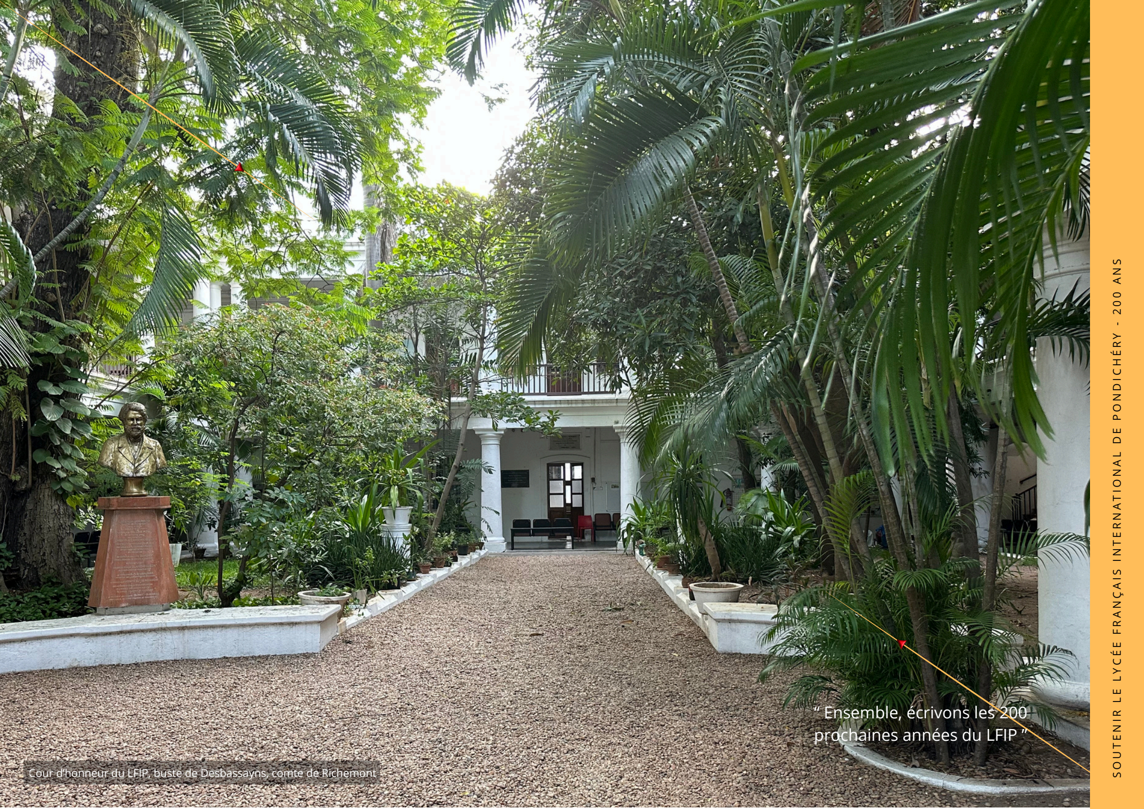
Cour d'honneur du LFIP, buste de Desbassayns, comte de Richemont

“ Ensemble, écrivons les 200 prochaines années du LFIP ”